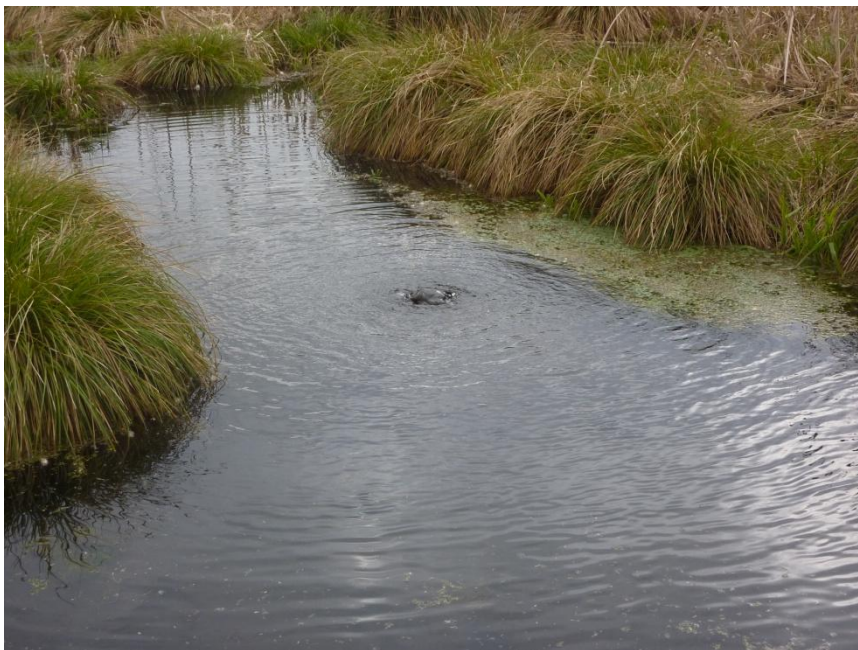
Puits artésien encore actif dans une ancienne fosse à cresson abandonnée.