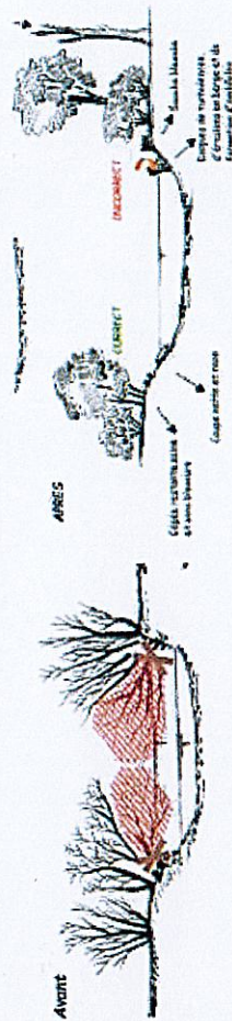
SCHEMAS DE PRINCIPE DES OPERATIONS D'ENTRETIEN DES BERGES DES COURS D'EAU